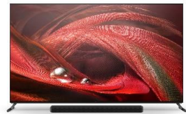
Pieds en position haute pour barre de son